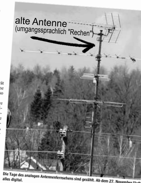
Die Tage des analogen Antennenfernsehens sind gezählt. Ab dem 27. November läuft alles digital.

alte Antenne (umgangssprachlich "Rechen")